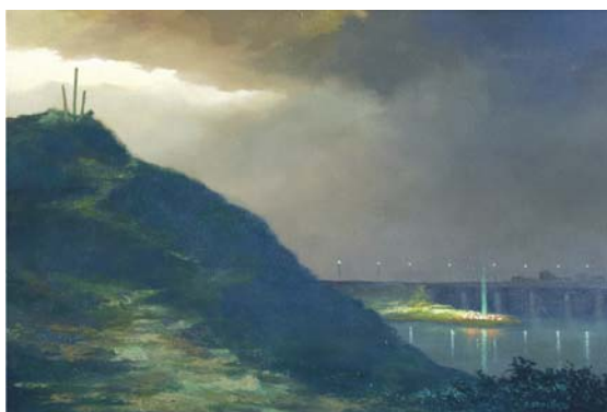
„KROPLA NADZIEI” - olej 40 x 60 cm